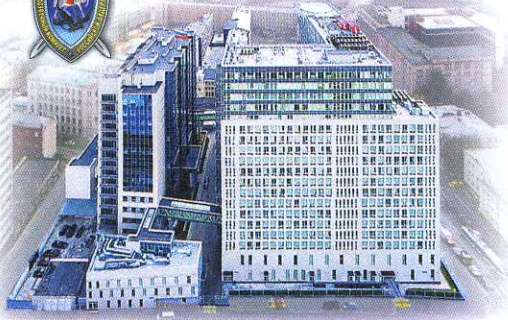
Москва. Комплекс зданий СК России

СЛЕДСТВЕННЫЙ КОМИТЕТ РОССИЙСКОЙ ФЕДЕРАЦИИ